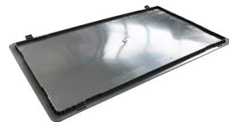
Couvercle E8601 en option