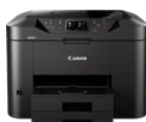
Série MAXIFY MB2750