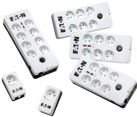
Gamme Eaton Protection Box