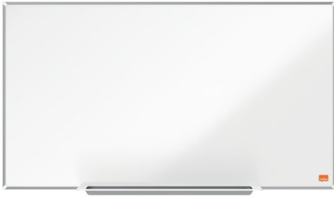
Tableau blanc écran large Nano Clean™ magnétique avec un cadre fin, moderne et élégant maximisant la surface d'écriture. Le système InvisaMount™ facilite le montage avec des fixations soigneusement dissimulées derrière le tableau blanc. Il est fourni avec un auget design pour ranger vos marqueurs et effaceurs. La surface magnétique Nano Clean™, vous offre une effaçabilité accrue pour une utilisation fréquente. Taille : 710x400mm.