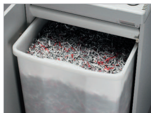
Réceptacle pratique de 165 litres avec poignée de préhension.