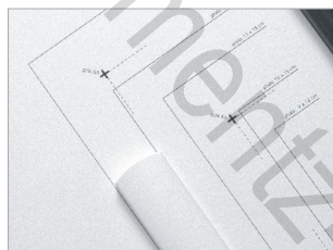
Tracés des formats papier et photos courants sur la table.