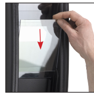
Fenêtres à insérer